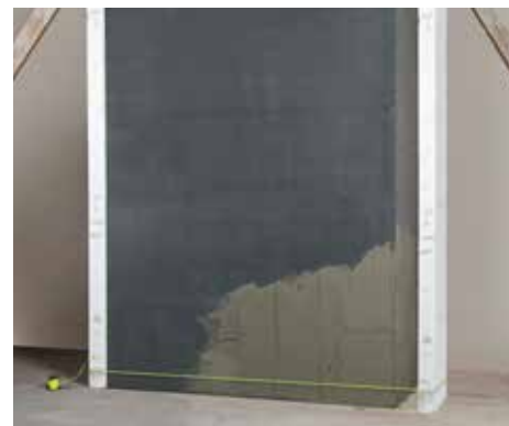
Des profilés de mesure correctement installés faciliteront la mise en œuvre.

Lors de l'indication des mesures, tenez compte de la largeur de joint souhaitée. Le compassage vertical équivaudra dès lors à la hauteur moyenne des plaquettes, majorée de la largeur de joint. La hauteur moyenne des plaquettes s'obtient en superposant dix plaquettes, sélectionnées aléatoirement parmi le lot livré, en mesurant la hauteur ainsi obtenue et en divisant celle-ci par 10. Répétez l'opération trois fois. Tendez ensuite un cordeau de maçon entre les profilés de mesure.