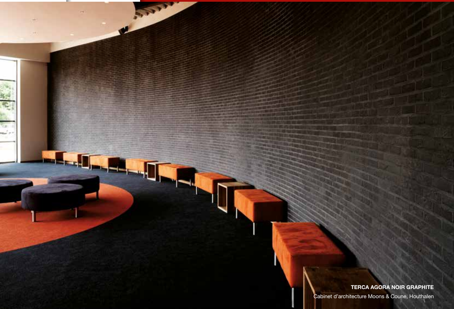
TERCA AGORA NOIR GRAPHITE Cabinet d'architecture Moons & Coune, Houthalen