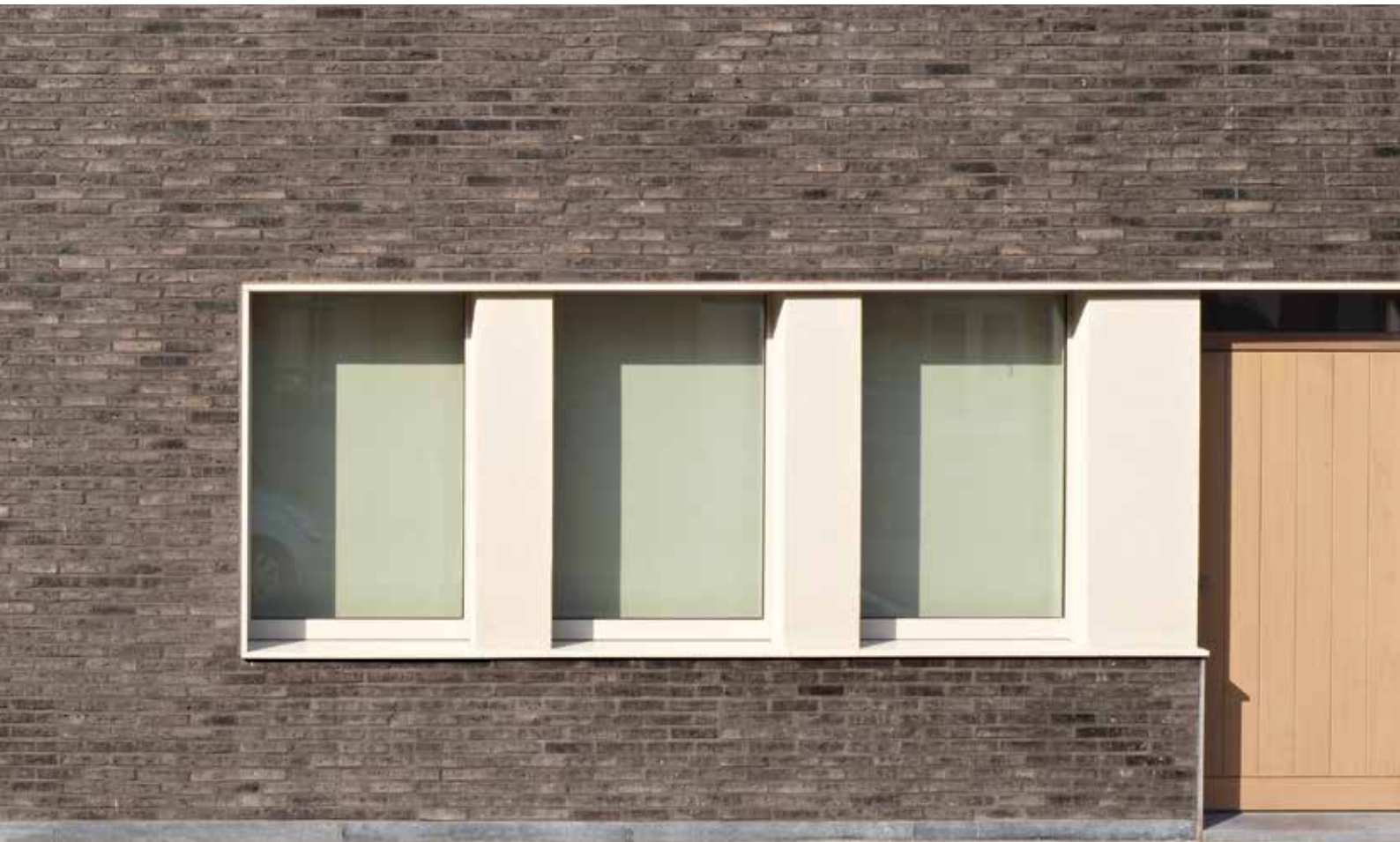
TERCA MILOSA COSMOS EXCLUSIEF Cabinet d'architecture A. Vanbiervliet bvba, Desselgem